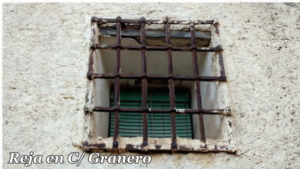
2 Reja en C/ Granero

Ventanuco protegido por una reja de forja con ojales en los barrotes horizontales y remaches perimetrales.