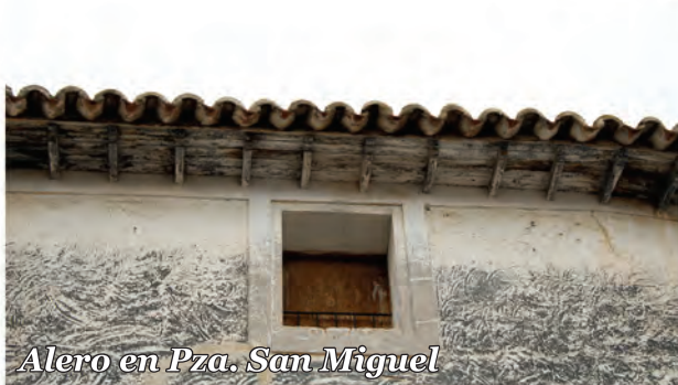
3 Alero en Pza. San Miguel

Alero de tablas con canecillos de madera en un edificio decorado con molduras planas en las impostas y recercados.