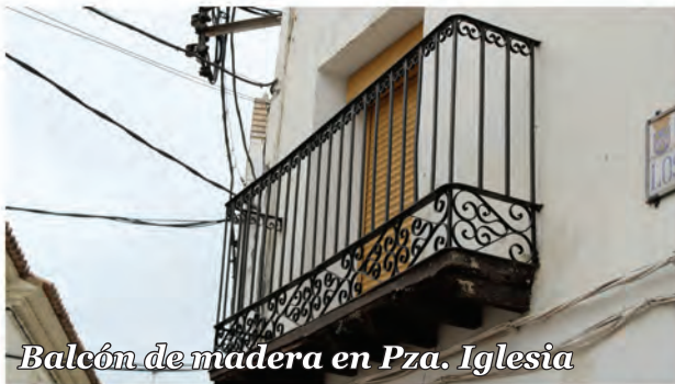
1 Balcón de madera en Pza. Iglesia

Balcón con ménsulas de madera y barandilla de forja con rodapié ornamental.