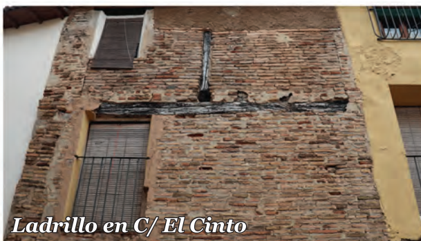
4 Ladrillo en C/ El Cinto

Fachada de ladrillo en la que se aprecia la carrera y las cabezas de las viguetas del forjado de la planta superior.