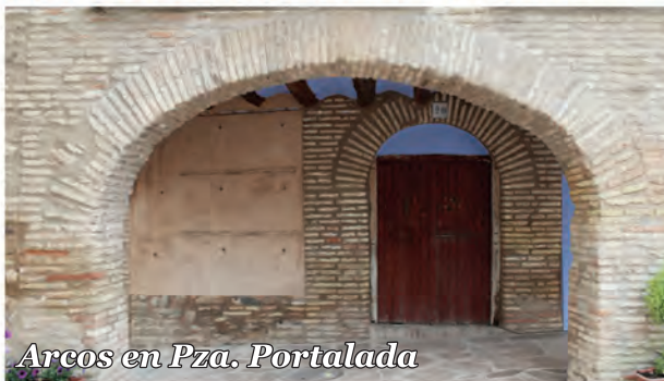
6 Arcos en Pza. Portalada

Este edificio muestra dos soluciones de arco de ladrillo: escarzano en la arcada de fachada y de medio punto sobre el acceso.