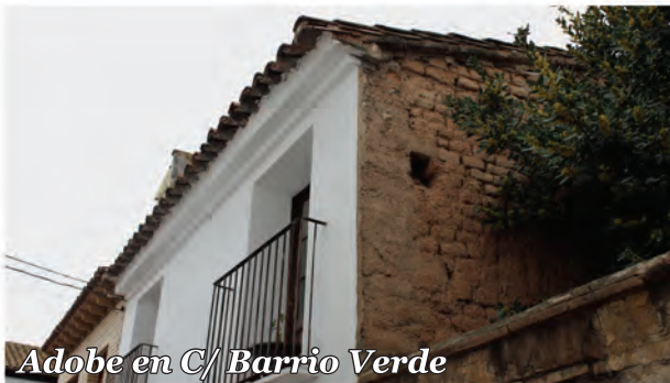
5 Adobe en C/ Barrio Verde

La medianera de este edificio demuestra que, tras la fachada recién arreglada, se esconde una construcción de adobe.