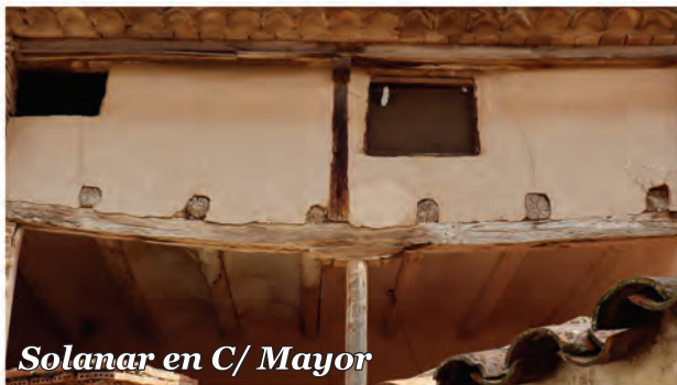
1 Solamar en C/ Mayor

Solamar en la entreplanta con cerramiento de yeso en el piso superior. Pie derecho central con una zapata de madera.