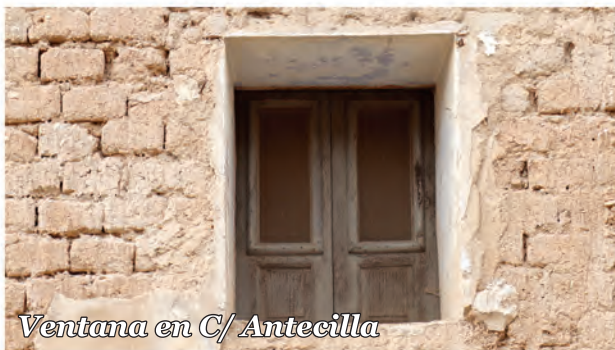
2 Ventana en C/ Antecilla

Edificio de adobe a tizón con ventana ciega de madera de dos hojas y aperturas para ventilación.