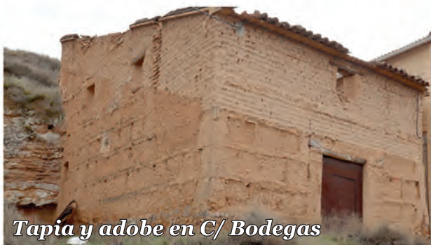
3 Tapia y adobe in C/ Bodegas

Edificio con muros de tapia con juntas de yeso en la parte inferior y un recreado de adobe en la parte superior.