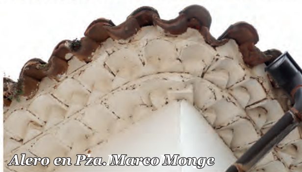
6 Alero en Pza. Marco Monge

Alero con solución en curva en esquina de tejas y ladrillos colocados en dos hiladas para alcanzar un mayor vuelo.