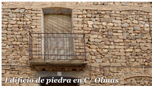
5 Edificio de piedra in C/ Olmas

Edificio realizado con muros de mampuestos y machones con bloques tierra-cemento, evolución de los adobes.