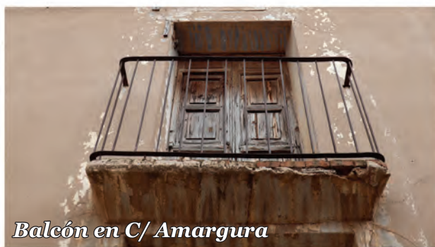
4 Balcón in C/ Amargura

Balcón con ménsula de ladrillo y moldura inferior y barandilla de forja. La carpintería es de madera con fraileros.