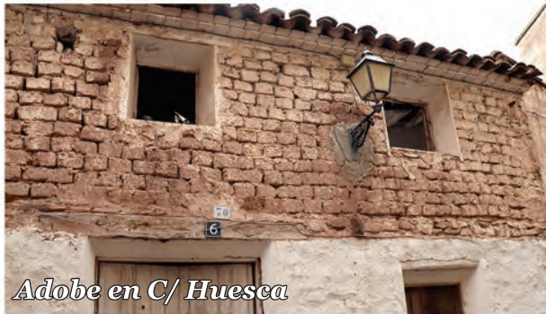
5 Adobe en C/ Huesca

Edificio con muros de adobe colocado a tizón, vanos con dintel de madera y alero conformado con ladrillos.