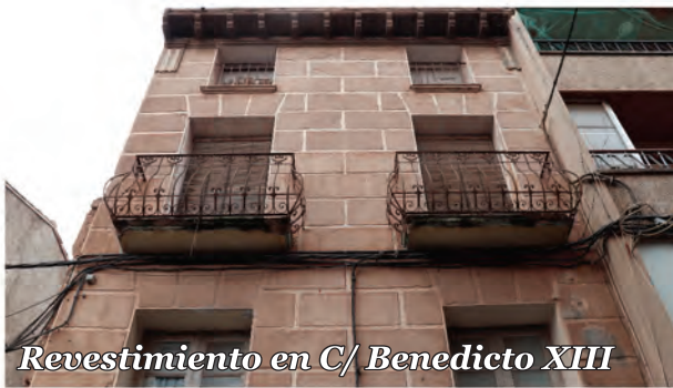
4 Revestimiento en C/ Benedicto XIII

Revestimiento con fingido de sillares y molduras en la parte superior. Balcones de forja con elementos ornamentales.