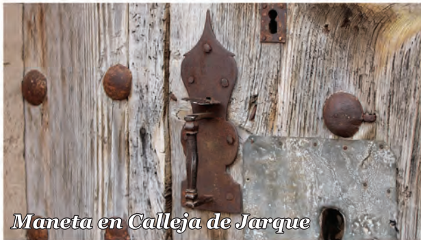
2 Maneta en Calleja de Jarque

Edificio de adobe con puerta de madera con clavos circulares y maneta metálica con pestillo.