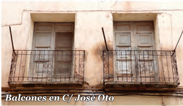
6 Balcones en C/ José Oto

Edificio de ladrillo con balcones de forja con elementos decorativos y carpinterías de madera con fraileros.