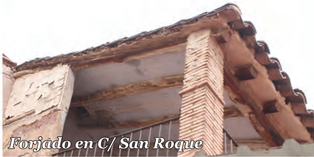
3 Forjado en C/ San Roque

Solano con cerramiento de adobe, pilar de ladrillo y cubierta de pares y entablado de cañizo.