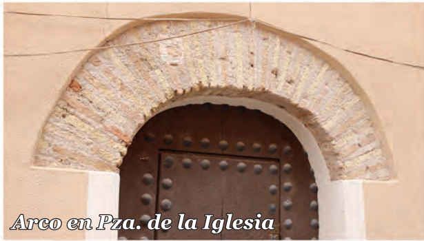
1 Arco en Pza. de la Iglesia

Arco de ladrillo en un hueco cerrado por un portón de madera con paso peatonal recortado y clavos ornamentales.