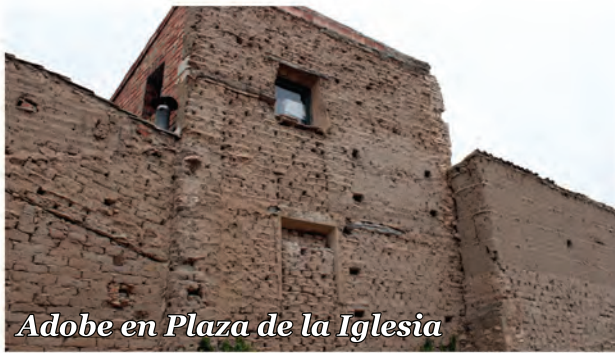
1 Adobe en Plaza de la Iglesia

Conjunto de edificios de adobe junto a un espacio de recreo. En las zonas más erosionadas del muro, sobresale la junta de yeso.