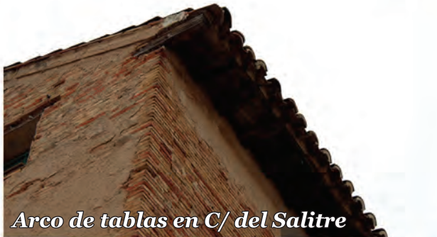
3 Arco de tablas en C/ del Salitre

Alero de tablas sostenido por canecillos de madera. En el lateral se aprecia cómo las piezas se anclan a la fachada de ladrillo.