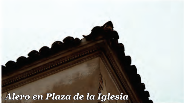
2 Alero en Plaza de la Iglesia

Alero de ladrillo recubierto con escayola para formar una moldura corrida con una hilada de denticulos.