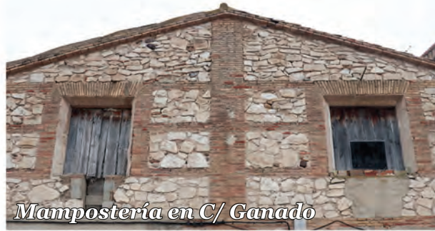
6 Mampostería en C/ Ganado

Muro de mampostería con machones y verdugadas de ladrillo. Arriba, piezas más pequeñas facilitan la forma triangular del hastial.