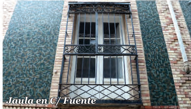
5 Jaula en C/ Fuente

Jaula practicable que puede cerrarse para proteger el hueco o abrirse en la parte superior para hacer las veces de balcón.