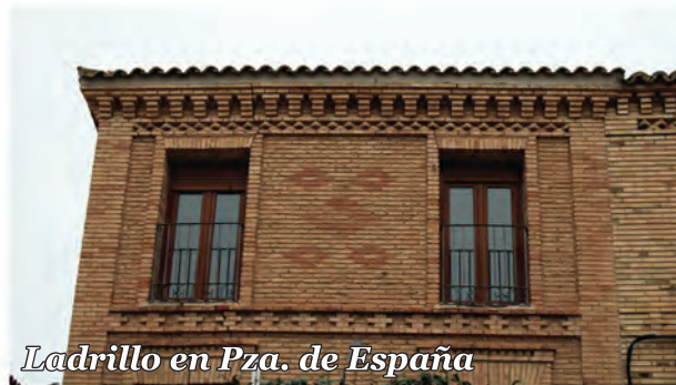
4 Ladrillo en Pza. de España

Fachada de ladrillo visto con elementos decorativos de este mismo material en el alero, las impostas y el recercado de los huecos.