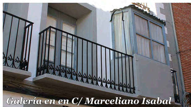
Galería en en C/ Marceliano Isabal

Edificio con balcones de forja y galería incorporada en uno de ellos con carpintería de madera y cuarterones.