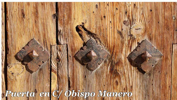
Puerta en C/ Obispo Manero

Puerta con clavos decorativos bajo arco en edificio con muros de ladrillo, alero de madera y balcon de forja.