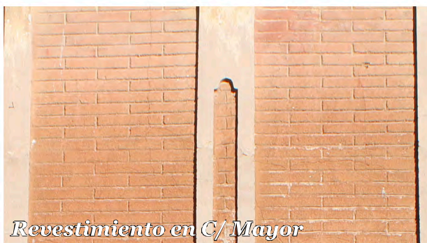
Revestimiento en C/ Mayor

Edificio con molduras decorativas de distintos tipos y fingido de ladrillo en toda la fachada.