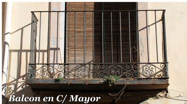
Balcon en C/ Mayor

Balcón de forja con elementos decorativos en la parte inferior de la barandilla y ménsula metálica.