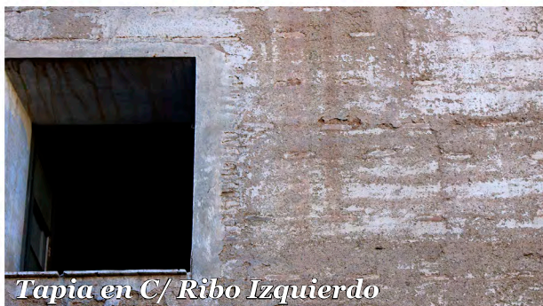
Tapia en C/ Ribo Izquierdo

Edificio de tapia suplementada con ladrillo, pilares de ladrillo y galería abierta en la parte superior.