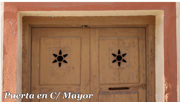
Puerta en C/ Mayor

Puerta de madera de dos hojas con cuarterones decorativos y dos ventanucos en forma de flor.